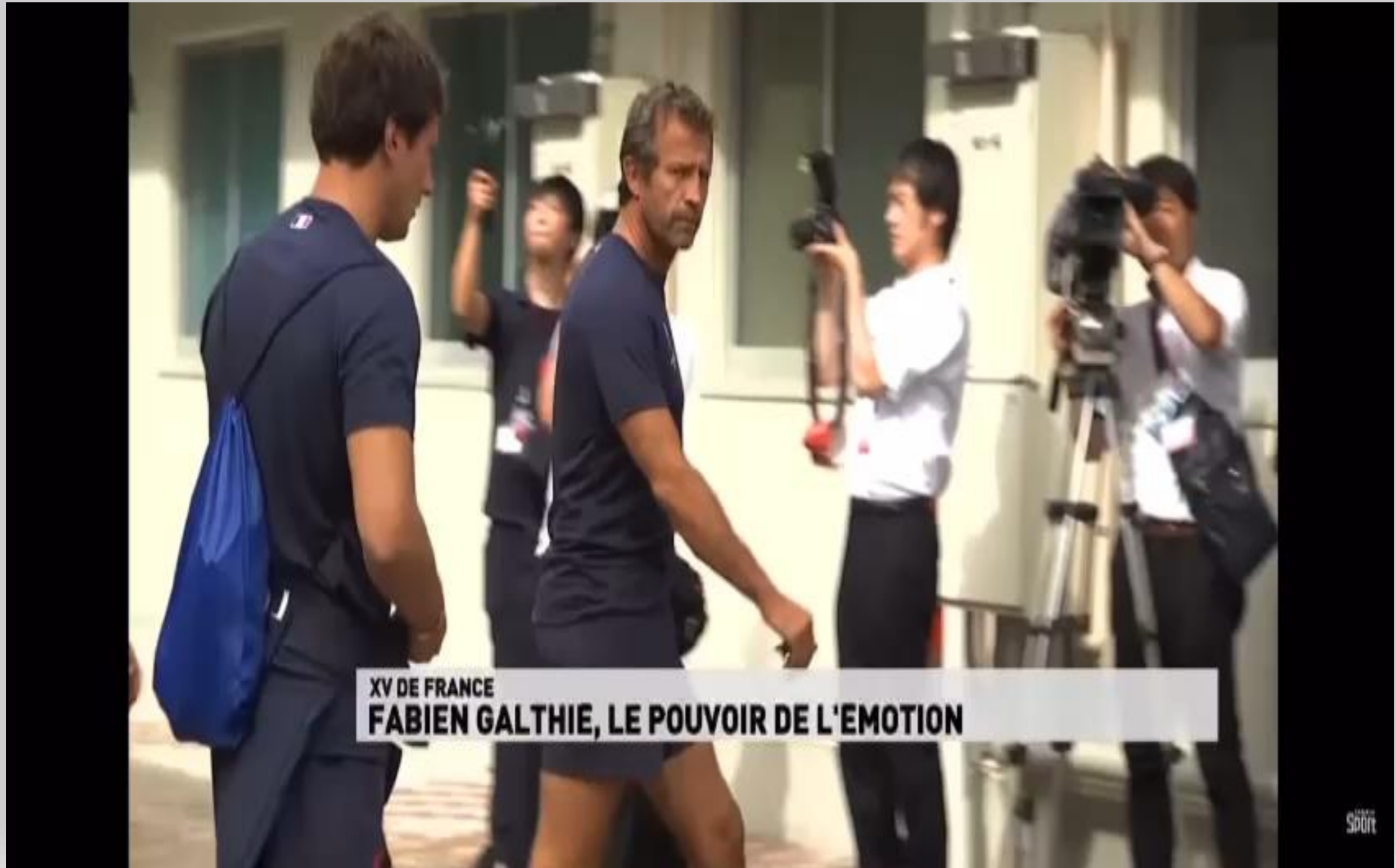
XV DE FRANCE FABIEN GALTHIE, LE POUVOIR DE L'EMOTION